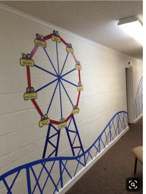
Over 40 Painters Tape Games and Activities